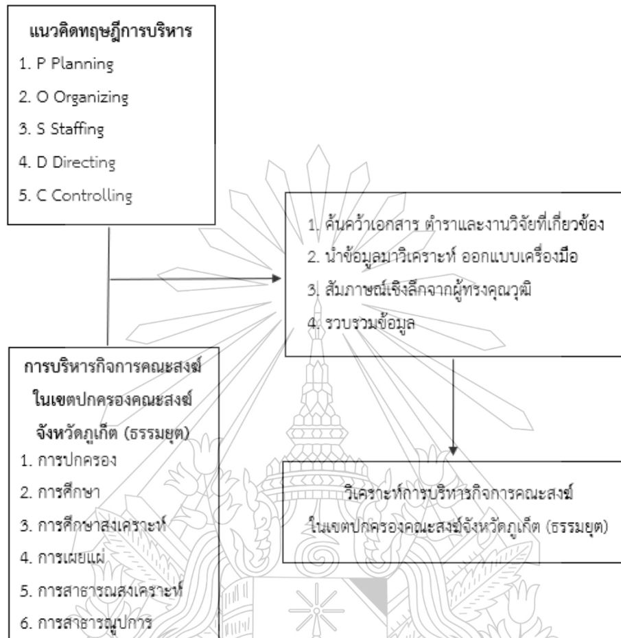
ภาพที่ 1.1 สรุปรอบแนวคิดที่ใช้ในการวิจัย